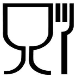
Рис. 1. Упаковка (укупорочные средства), предназначенная для контакта с пищевой продукцией

Символ, обозначающий, что упаковка предназначена для контакта с пищевой продукцией, допускается наносить как без рамки, так и в рамке (круглой, квадратной и др.).